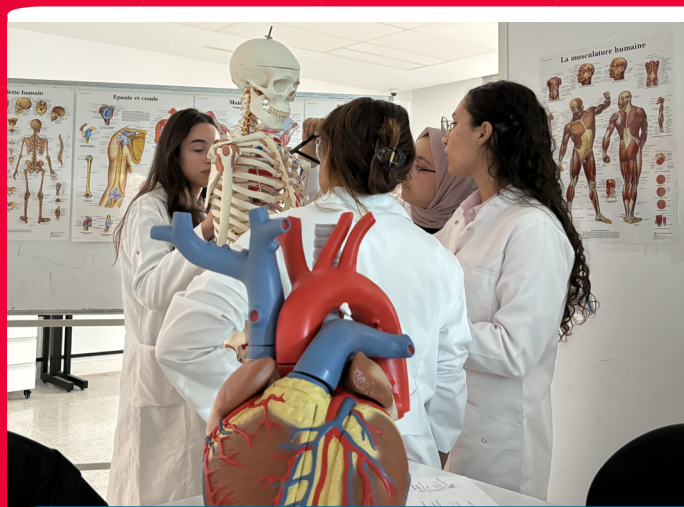
DOCTEUR EN MÉDECINE