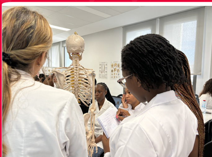
DOCTEUR EN MÉDECINE

Le cycle de doctorat est une formation à la recherche et par la recherche, sanctionnée par l'obtention du diplôme de Doctorat (Ph.D.) en Sciences Médicales et Biomédicales, après soutenance des travaux de recherche devant un jury. Cette formation doctorale en recherche est organisée au niveau du Centre d'Etudes Doctorales en sciences médicales de l'Université Euromed.